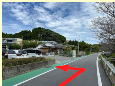
荒尾方面からお越しの場合