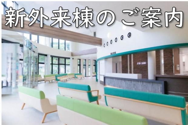
①外来受付と待合の様子 広々とした空間と、窓から入る光が印象的な外来。