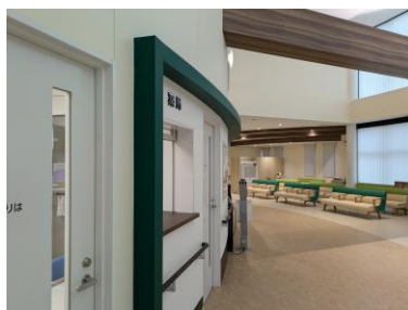
③薬局窓口 受付のすぐ左隣にある窓口で、お薬をお渡しします。