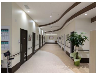
④診察室前の廊下 診察室と各種相談室は、受付向かって右手に並びます。

左の写真は新しい外来棟の待合と受付になります。とても開放感にあふれ、我々もそうでしたが、以前を知る方から、その変化の大きさに「広くなったねえ」「きれいになったねえ」と、驚きを乗せて感想を聞かせて頂いています。もちろん印象ががらりと変わったことで、戸惑いも抱かせてしまった方もおられると思います。新たな環境が、皆様に安らいでいただける場所となるように、温かくやわらかな思いをもってお迎えしていこうと、外来スタッフ一同努めていく所存です。なにかございましたらお気軽にお声がけください。