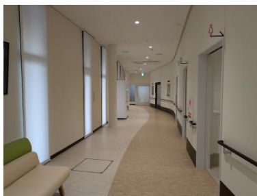
②検査室等へ続く廊下 正面左手の廊下。種々の検査を行う検査室に加え、トイレや自販機もこちらに。