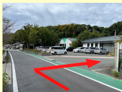
勝立方面からお越しの場合

現在、外来棟リニューアルオープンに伴いまして、当院の入口が変更となっております。入口看板を設けておりますので、そちらを目印にお越しください。